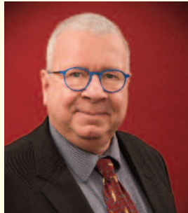
Karlheinz Jepp Schule am Kleinen See

“Klimaschutz und eine zuverlässige Energieversorgung aus erneuerbaren Ressourcen, die bezahlbar bleibt.”