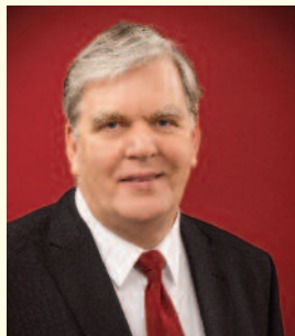
Klaus Kibbel Kreisberufsschule

“Das bereits viel zu lange andauernde Leerstehen von Gewerbeimmobilien in der Eutiner Innenstadt muss beendet werden.”